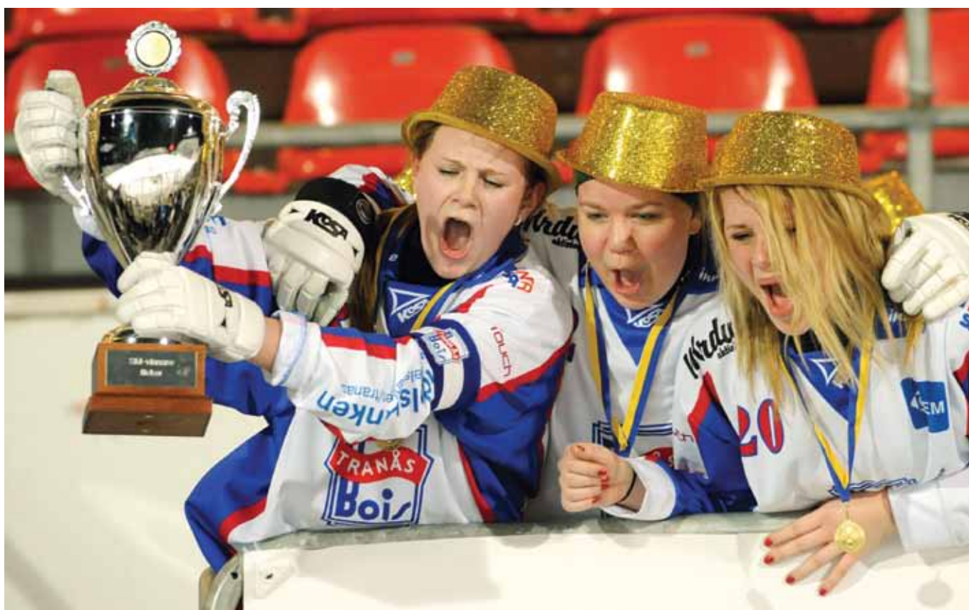
Spelarna i Tranås Bois skriker ut sin glädje efter att man säkrat segern i F19-finalen på Studenternas.