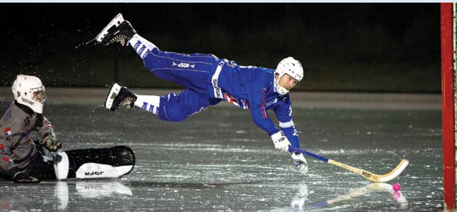
Årets bandybild 2012.