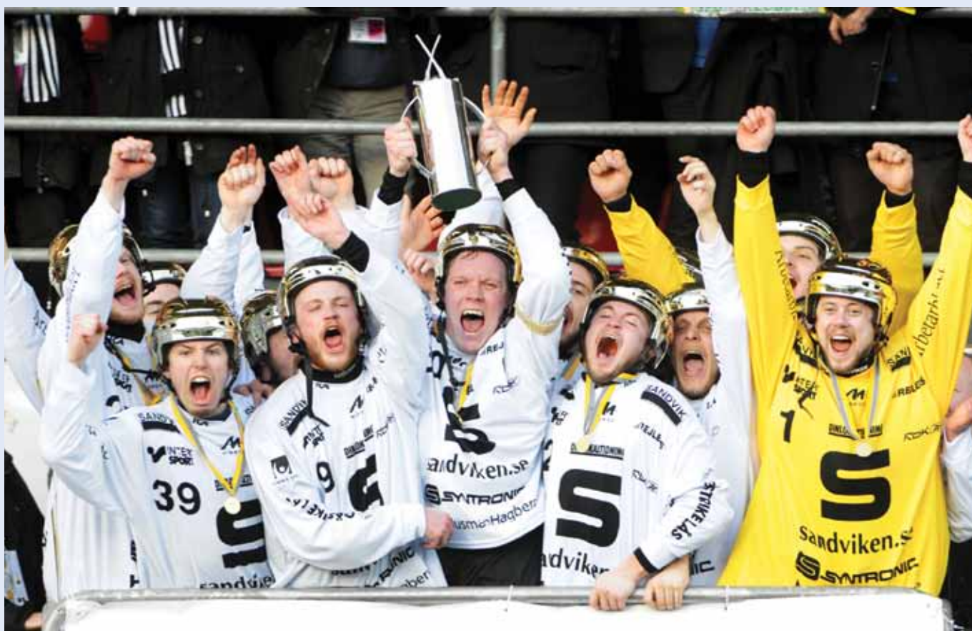
Sandvikens AIK fick höja SM-pokalen för andra året i rad.