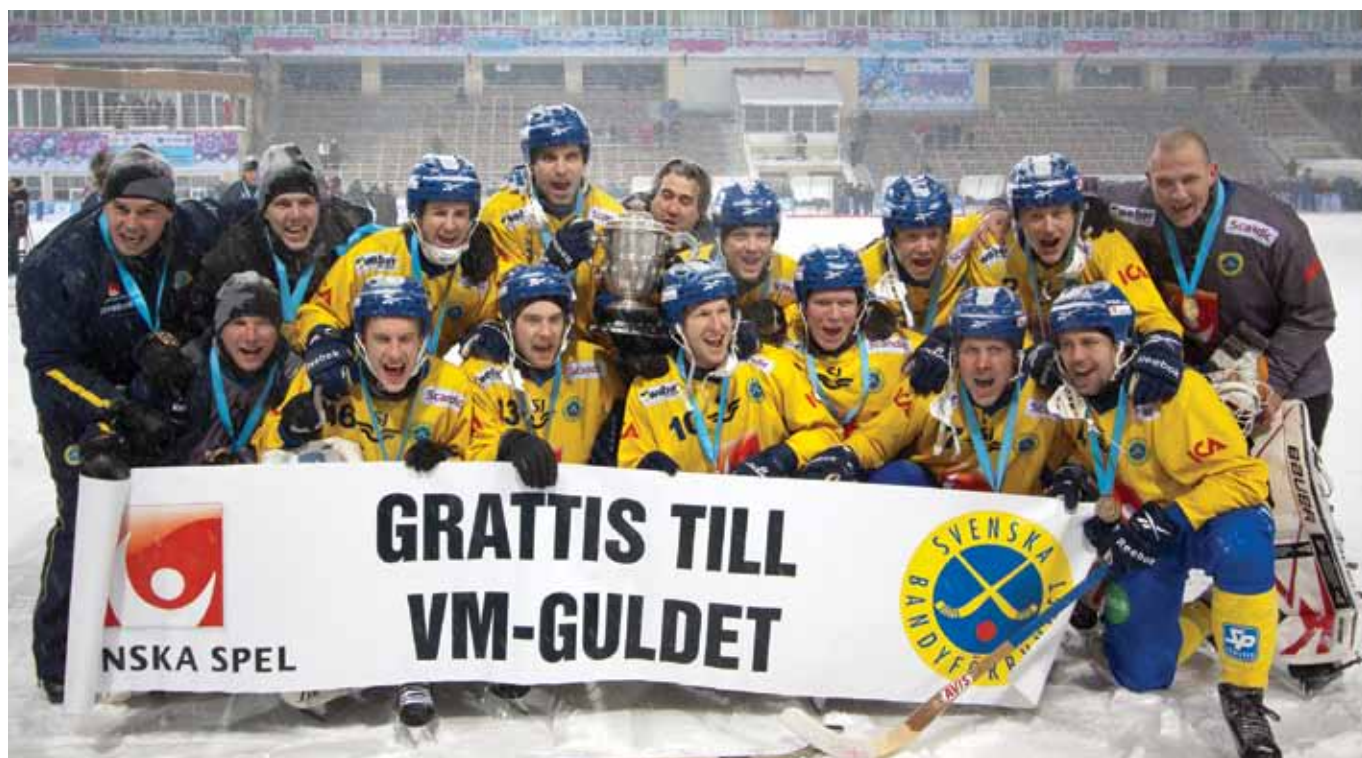
Ett överlyckligt herrlandslag har just besegrat Ryssland i en dramatisk VM-final.