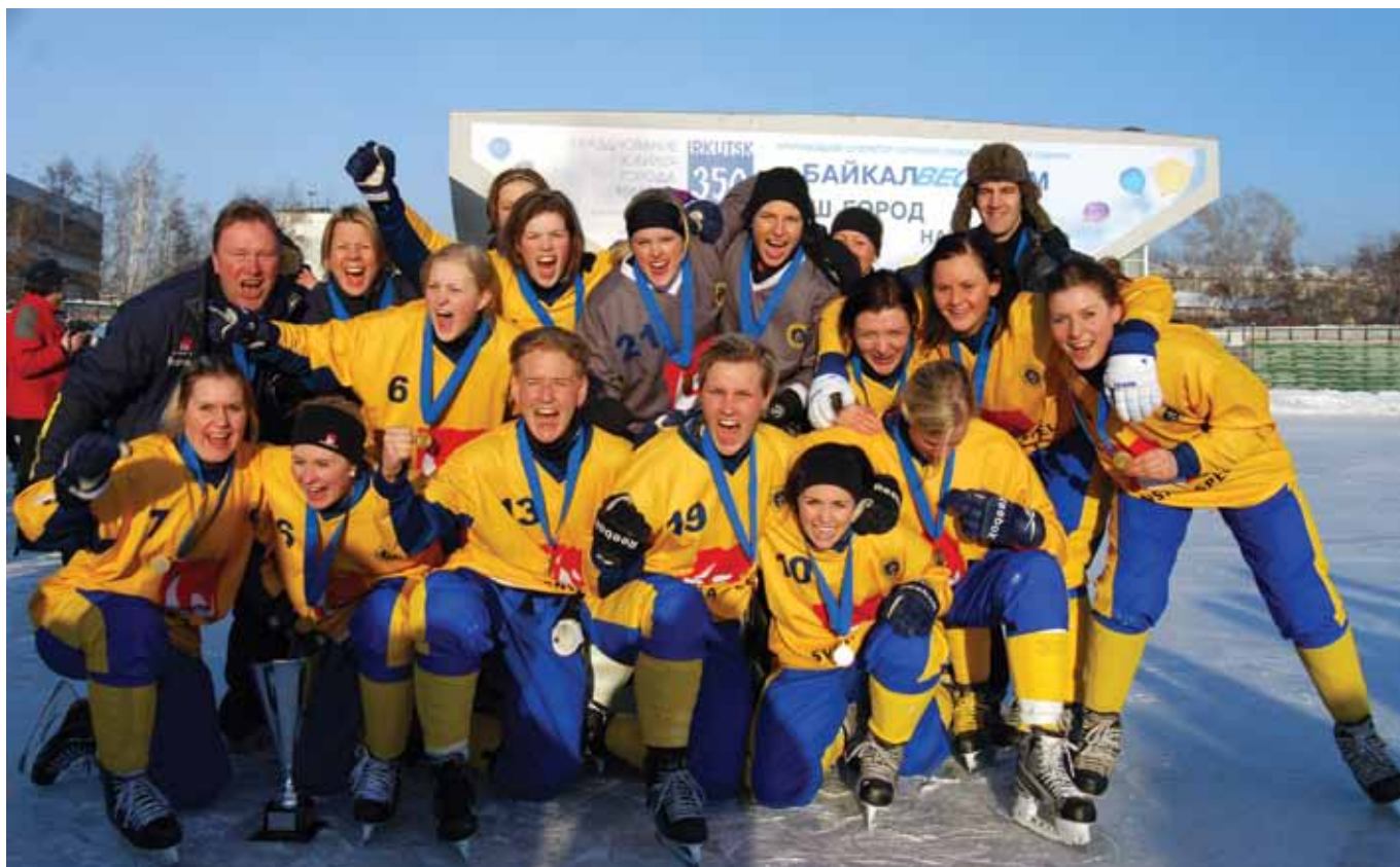
Guldjubil i Sibirien.

P15-landslaget: VM-silver i Arkhangelsk, Ryssland.