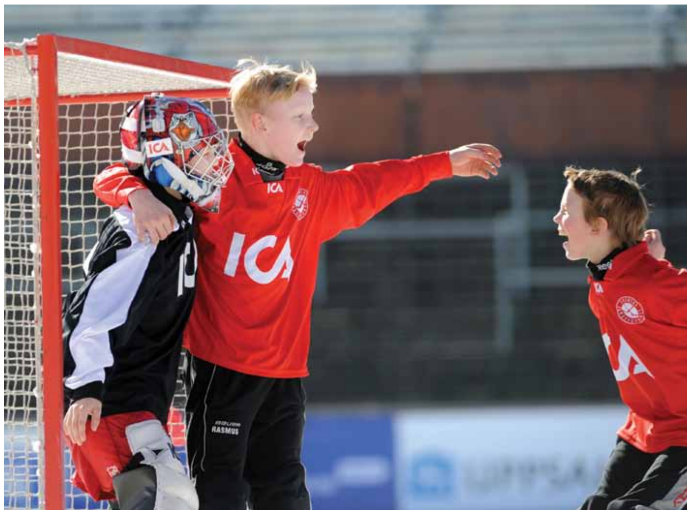
Glädje i klass 5H på Stenhammarskolan, Lidköping, sedan man vunnit finalen i ICA Miniallsvenskan.