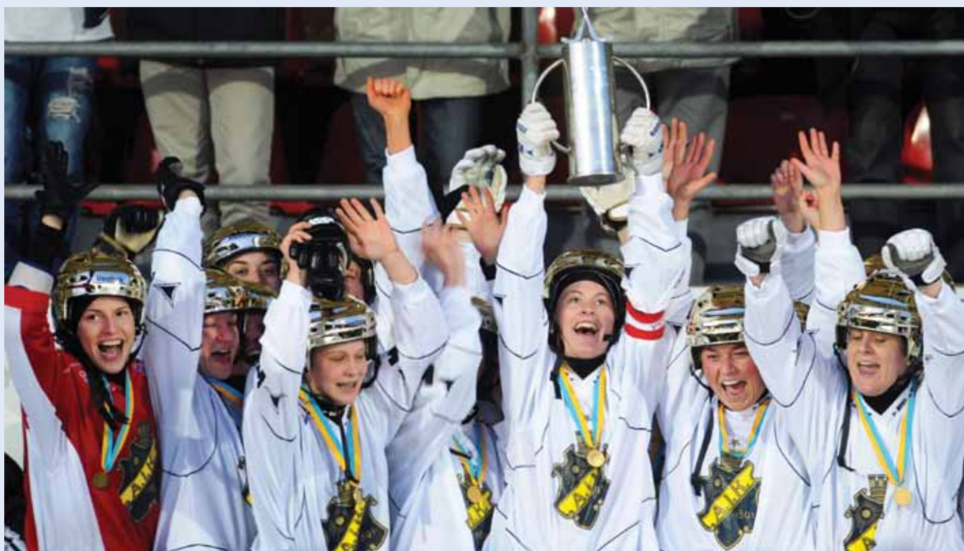
AIK återtog dambandytronen genom att besegra Sandvikens AIK i SM-finalen.