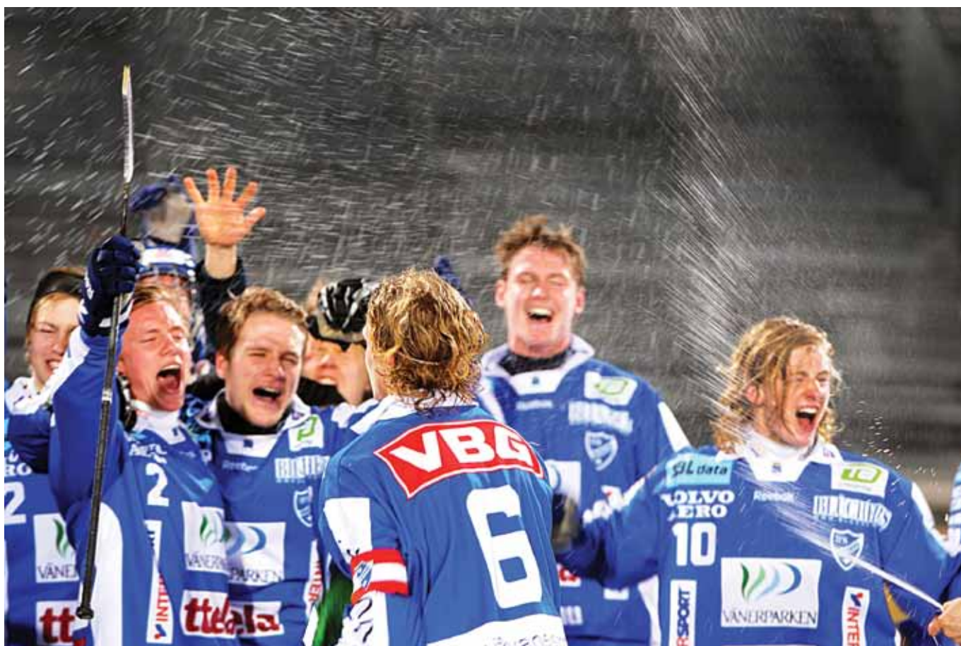
Efter tre raka finalförluster vann IFK Vänersborg ett efterlängtat guld i junior-SM.